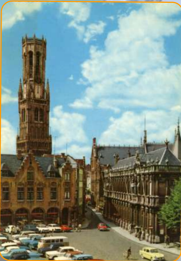
Chef-lieu d'une province flamande