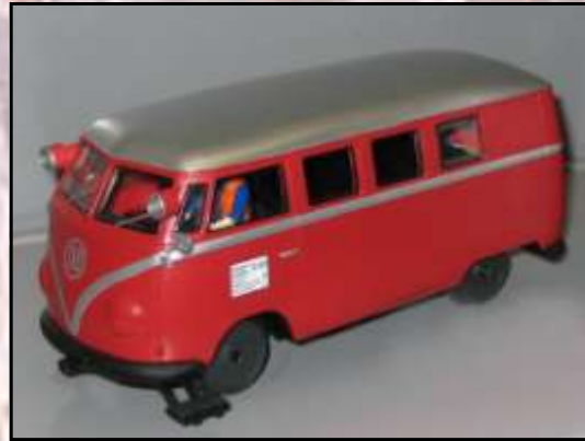
Le modèle réduit et l'original